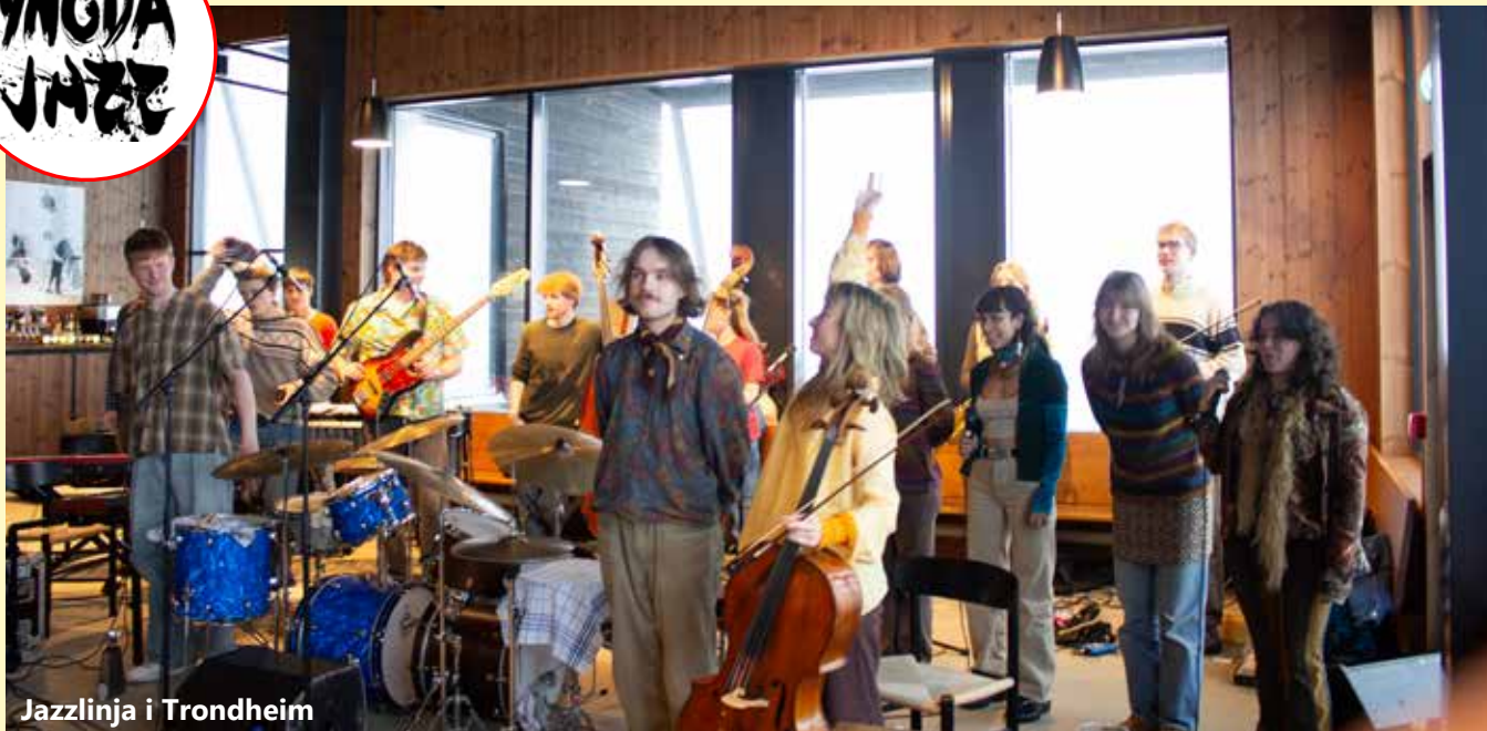
Jazzlinja i Trondheim

Vossa Jazz har lenge jobba med å rekruttera ungdom til festivalen, både som musikarar, medarbeidarar og publikum. Det er viktig å utvikla og utvida ulike målgrupper, og dette arbeidet gjev resultat! I 16 år har me hatt besøk av 2. klasse ved Jazzlinja i Trondheim , og denne gongen var « TELL US » på turné. Som tidlegare år inviterte me ungdom frå ulike skular til gratiskonsert, og med fullt hus av ungdommar og elevar frå vaksenopplæringa i kommunen vart det ein knall tjuvstart på årets festival i Gamlekinoen. Denne gjengen tok og turen og spelte i Gondolane, i tillegg til ein konsert på Hangurstoppen.