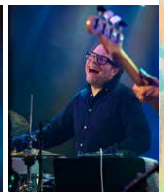
Best Western Swing sette eit forrykande punktum på laurdagsnatta i Vossasalen.