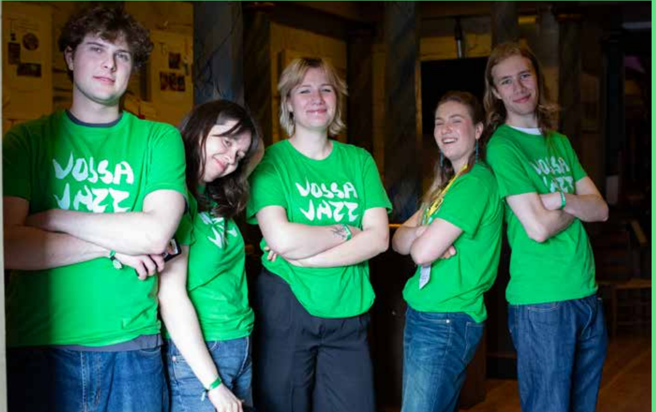
197 knallgode medarbeidarar sytte for at gjennomføringa av Vossa Jazz 2024 gjekk på skjener.